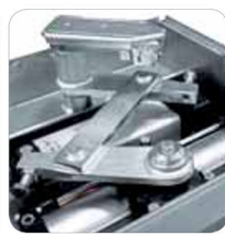
Particular de la centralita y gato