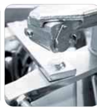
Particular de desbloqueo de emergencia