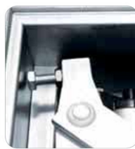
Tope mecánico interno de la caja